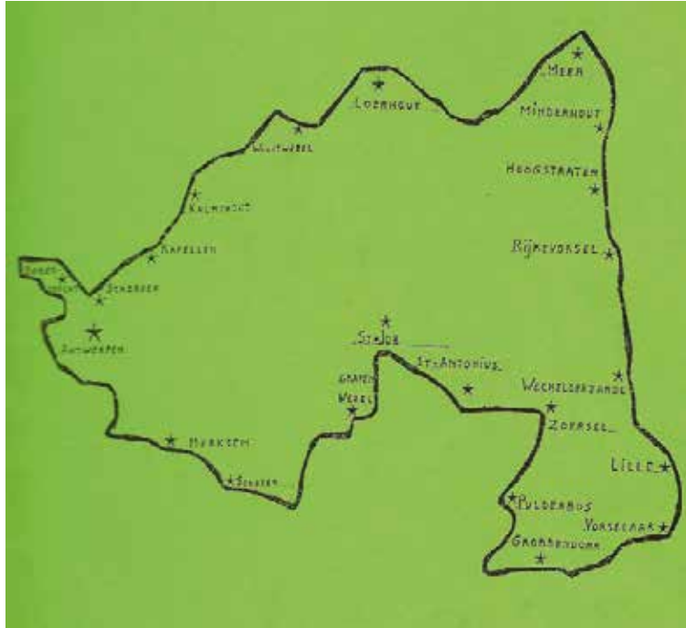
Parcours 1 e Antwerpse Havenpijl