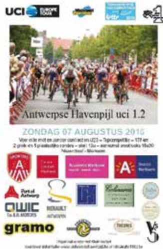
Flyer voorkant (A5 formaat) – achterkant algemene informatie